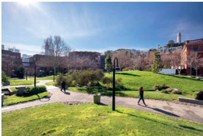
Der Bürokomplex umfasst zwei öffentliche Plätze und mehrere Grünanlagen

Das Objekt ist derzeit zu 98% an insgesamt 33 Mieter vermietet. Der mit Abstand größte Mieter mit einer Mietfläche von rund 36.370 qm (42% der Gesamtfläche) und Namensgeber des Bürokomplexes ist die traditionsreiche Firma Levi Strauss & Co. Mit mehr als 500 Geschäften in über 100 Ländern und einem