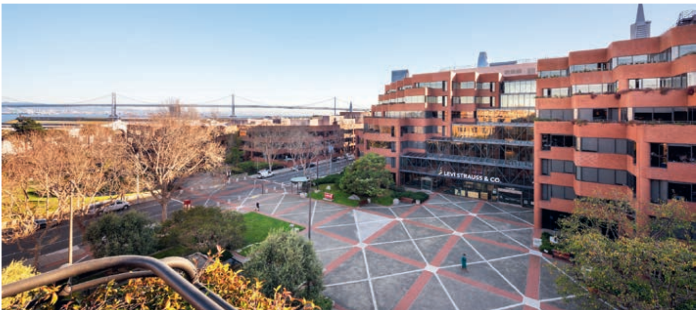
Levi's Plaza befindet sich im Teilmarkt North Waterfront mit direkter Lage am östlichen Ufer der Innenstadt

Die beschriebene Strategie führt in der Jamestown Prognose dazu, den für 2020 budgetierten Nettomietüberschuss von $ 27,4 Mio. auf $ 70,5 Mio. bis 2032 zu steigern. Die Verkaufshypothese unterstellt, das Objekt Ende 2031 zu einem Multiplikator von 16,67 zu veräußern, sodass sich ein Bruttoverkaufspreis in Höhe von $ 1,18 Mrd. ergibt. Nach anteiliger Fremdmittelrückführung und Verkaufsnebenkosten entfallen gemäß Verkaufshypothese auf die Jamestown 31 Anleger Verkaufsrückflüsse vor Steuern von rund $ 170 Mio. bzw. rund 116% des anteiligen Fondseigenkapitals von $ 146,4 Mio. Je nach Investitionsverlauf kann sich auch ein erheblich geringerer oder höherer Wert ergeben. Alle Entscheidungen zu Investitionsstrategie und solche zu Fremdfinanzierung und Verkauf trifft allein die Jamestown, L.P. als Komplementärin.