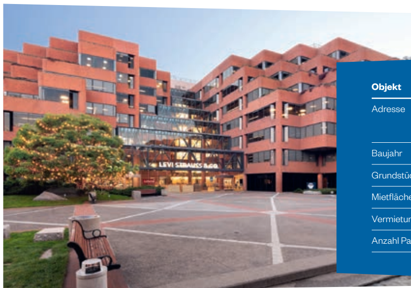
Hauptgeschäftssitz von Levi Strauss & Co.

Der Großraum San Francisco ist mit 7,8 Mio. Einwohnern die viertgrößte Metropolregion in den USA. Die wirtschaftliche Dynamik ist besonders geprägt durch viele und bekannte Unternehmen aus der Technologiebranche, wie beispielsweise Google, Facebook und Apple. Die hohe Nachfrage nach großen Büroflächen, insbesondere durch die stark expandierenden Technologieunternehmen und den Mangel an Angeboten, führte in den letzten Jahren auf dem Immobilienmarkt zu niedrigen Leerstandsquoten und ansteigenden Mieten.