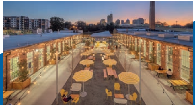
Einzigtartiges Büro- und Einzelhandelskonzept in einem aufstrebenden Stadtteil

Hinweis zur Pandemie: Aufgrund der Corona-Pandemie kann es zu zusätzlichen Mietausfällen und längeren Vermietungszeiträumen kommen, als in den Prognosen unterstellt wurde.