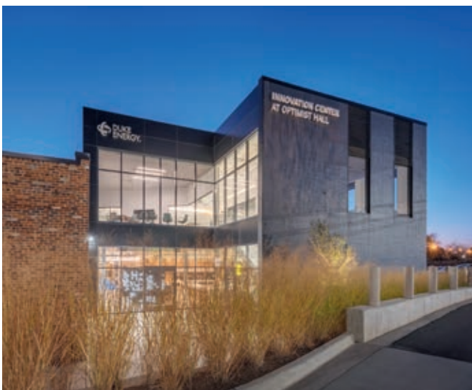
Duke Energy hat einen Zehnjahresvertrag für die gesamten Büroflächen abgeschlossen

Die Büro- und Einzelhandelsimmobilie ist derzeit zu 94% an einen Büromieter sowie 22 Einzelhändler und Restaurantbetreiber vermietet. Der größte Mieter ist der Energieversorger Duke Energy, der die gesamten Büroflächen (8.429 qm) für die nächsten zehn Jahre belegt. Duke Energy ist im Aktienindex S&P 500 gelistet und beliefert sieben Bundesstaaten mit elektrischer Energie. Das Unternehmen hat in Charlotte seinen Firmensitz und betreibt in den Flächen sein Innovationszentrum. Der Vermietungsstand der Einzelhandels- und Gastronomieflächen (3.616 qm) liegt aktuell bei 77% und der Mietermix besteht überwiegend aus regionalen Einzelhändlern und Restaurantbetreibern mit einer durchschnittlichen Mietlaufzeit von 6,7 Jahren ab 2020.