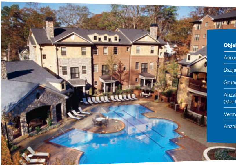
Zu den zahlreichen Gemeinschaftsflächen für Mieter gehören auch mehrere Poolanlagen

Der Ankauf der Mietwohnanlage Rock Springs Court erfolgte am 22.12.2020. Zur Bewertung vor Ankauf wurden