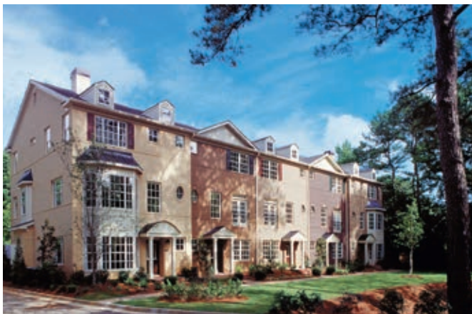
Gepflegte Reihenhäuser umgeben von einem alten Baumbestand

Basierend auf einem Investitionsvolumen von $ 159 Mio. und einem Hypothekendarlehen von $ 87 Mio. ergibt sich ein Fondseigenkapital von $ 72 Mio.