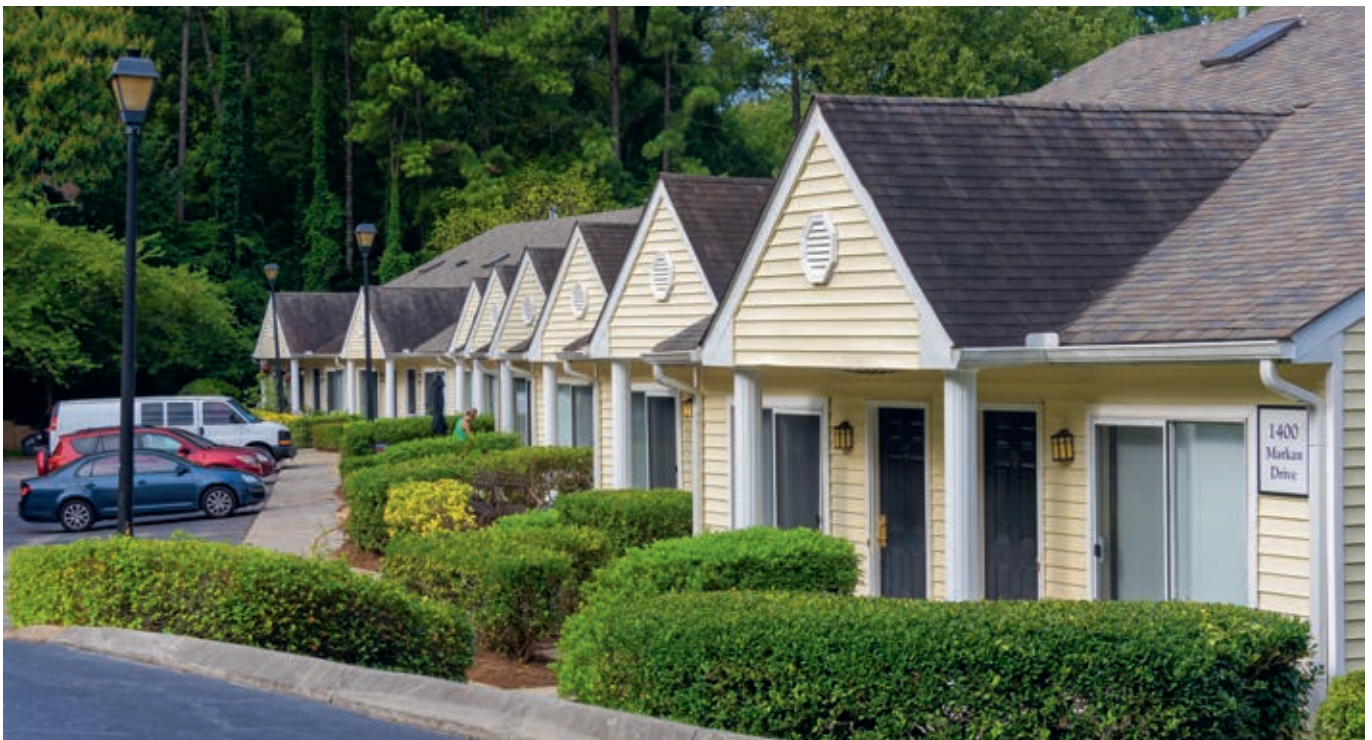
Wohneinheiten mit Garten der ersten Bauphase, fertiggestellt im Jahr 1987

Gemäß der Jamestown Prognose ergeben sich aus der Immobilieninvestition Rock Springs Court Barüberschüsse an den Fonds, die die prospektgemäße Ausschüttung an die Anleger von 4% p.a. zwischen 2022 und 2031 und 110% Rückfluss aus Verkauf in 2031 bezogen auf das anteilig entfallende Fondseigenkapital ohne Ausgabeaufschlag erwarten lassen. 1