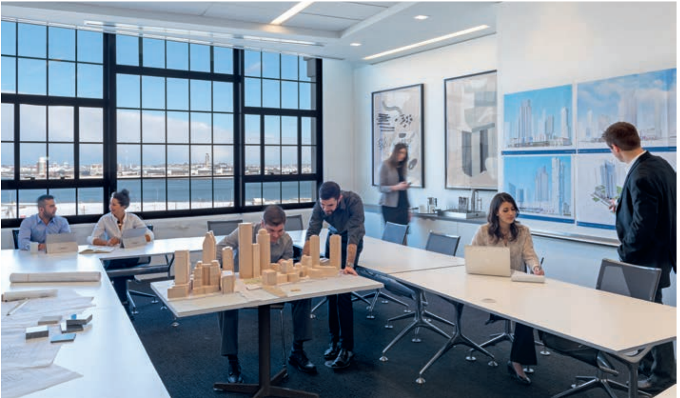
Über 1.000 Fenster wurden im Zuge von Modernisierungsarbeiten ausgetauscht

Grundlage für die Investitionsentscheidung waren die Lage des Investitionsobjektes im Seaport District, die Flexibilität des Objektes zur Repositionierung als Innovations- und Technologiezentrum sowie die gestiegene Nachfrage nach Laborflächen durch den Biotechnologiesektor in diesem Teilmarkt.