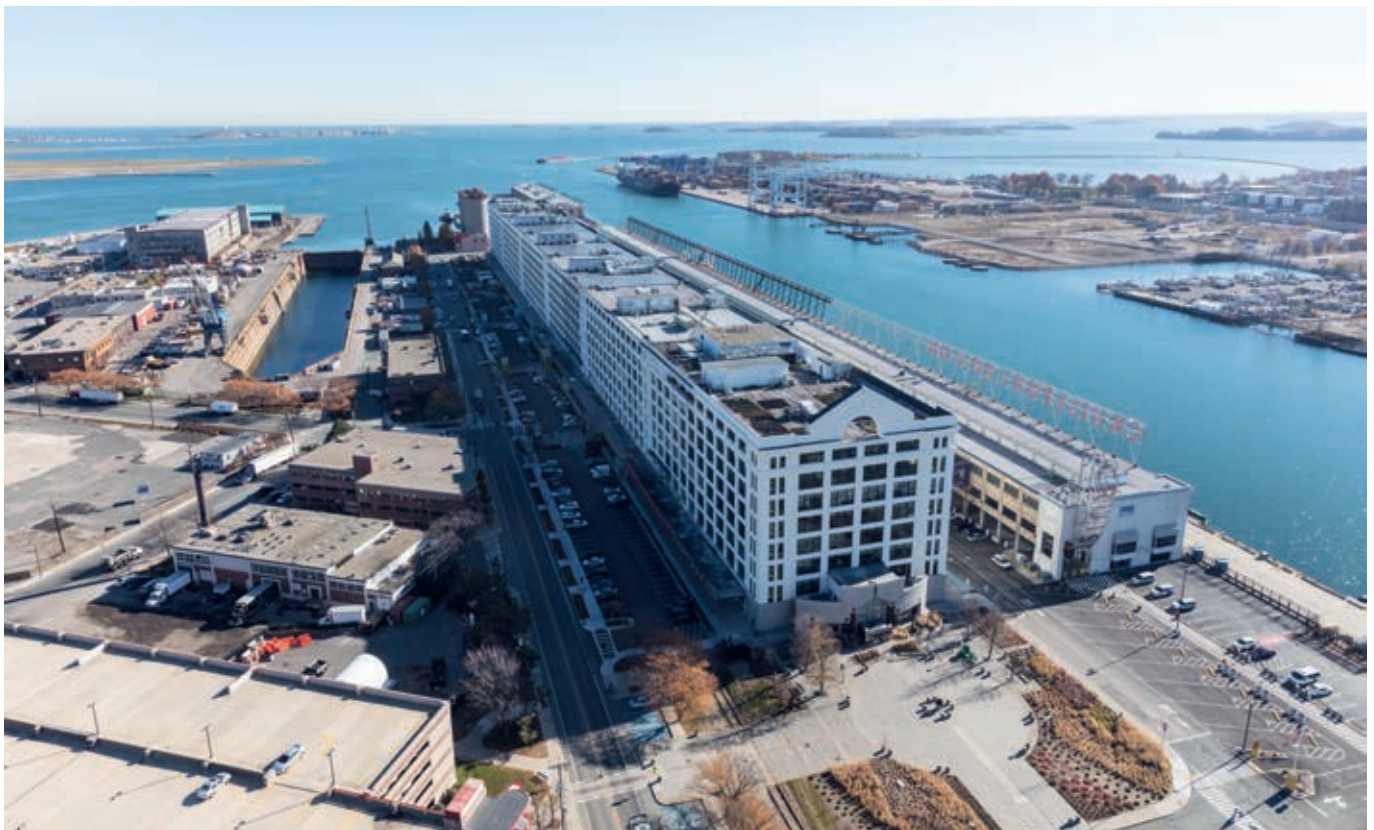
Gesamtobjekt umgeben von Trockendocks und der Anlegestelle für Kreuzfahrtschiffe in Boston

Die Auswirkungen der Corona-Pandemie waren 2020 aufgrund des geringen Anteils an Einzelhandel und Gastronomie im Investitionsobjekt gering. In 2020 wurden mehrere Mieter mit Mietnachlässen von insgesamt $ 276.000 und Mietstundungen von insgesamt $ 1,2 Mio. unterstützt. Dies entspricht in Summe weniger als 3% der Jahresmieteinnahmen des Investitionsobjektes. Gemäß den vertraglich festgehaltenen Rückzahlungsplänen sind in 2021 noch $ 560.000 an gestundeten Mieten ausstehend. Bisher gab es keine Insolvenzen.