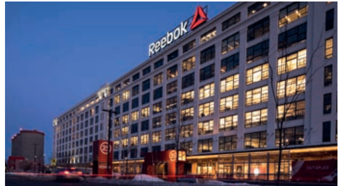
In 2017 verlegte Reebok seine Firmenzentrale in das Innovation and Design Building

Warnhinweis: Prognosen sind kein verlässlicher Indikator für die Wertentwicklung in der Zukunft. Es bestehen immobilien-spezifische Risiken, unter anderem ein Anschlussvermietungsrisiko nach Auslaufen von Mietverträgen sowie das Risiko einer negativen Standortentwicklung. Darüber hinaus besteht ein Vermietungsrisiko, welches zu einer Minderung der Ausschüttungen führen kann. Ferner besteht ein Risiko aus dem Einsatz von Fremdkapital.