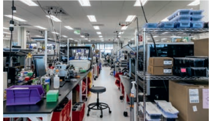
Die Investitionsstrategie sieht eine Ausweitung der Laborflächen für Biotechnologieunternehmen im Objekt vor

Einzelhandelsflächen. Aufgrund der flexiblen Grundrissgestaltung und kurzfristig verfügbarer, in einem Gebäudeteil konzentrierter Flächen von ca. 25.200 qm bietet das Investitionsobjekt die Möglichkeit, diese zu Laborflächen auszubauen und hochpreisig zu vermieten. Laborflächen für die Biotechnologie unterliegen hohen Anforderungen, so dass eine solche Flächenumwandlung kostenintensiv ist. Hierfür sind rund $ 95 Mio. budgetiert, deren Finanzierung durch die neu geschaffene Joint Venture-Struktur erleichtert wird.