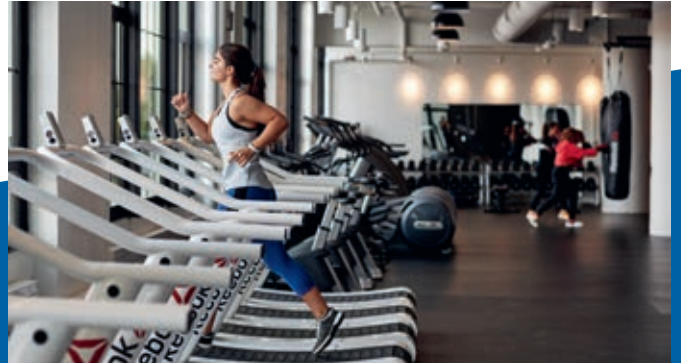
Zwischen dem Investitionsobjekt IDB und Boston Downtown erstreckt sich das aufstrebende Hafenviertel Seaport District

Hinweis zur Pandemie: Aufgrund der Corona-Pandemie kann es zu zusätzlichen Mietausfällen und längeren Vermietungszeiträumen kommen, als in den Prognosen unterstellt wurde.