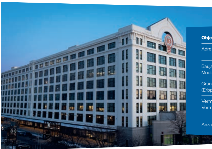
Nordwestseite des ehemaligen Militärlagerhauses mit einer Länge von über 400 m

dynamisch entwickelte. Vor allem innovative Technologieunternehmen zog es in den Stadtteil, in dem auch die Messe- und Veranstaltungshallen der Boston Convention and Exhibition liegen. Durch den verstärkten Zuzug von Biotechnologieunternehmen bildet sich im Hafen von Boston ein Innovations-Hub und naturwissenschaftliches Zentrum heraus. Die Anbindung an den öffentlichen Nahverkehr ist