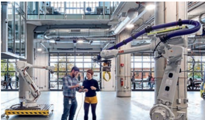
Variable Grundrisse und hohe Decken bieten Raum für Forschung und Entwicklung

Nach Einschätzung von Jamestown verzeichnet der Teilmarkt seit ca. zwei Jahren eine stark steigende Nachfrage nach höherwertigen Laborflächen im Bereich der Biotechnologie. Diese erzielen deutlich höhere Mieten als Büro- und