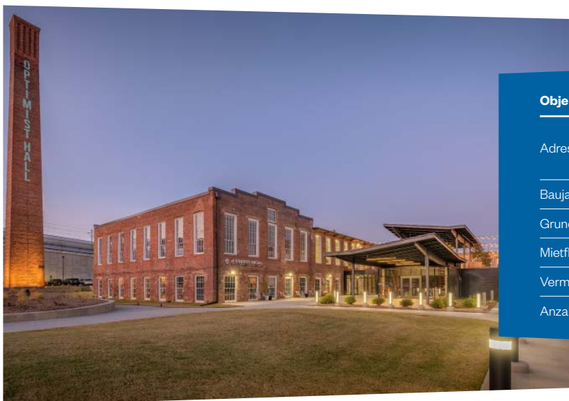
Die ehemalige Textilfabrik Optimist Hall wurde zu einer Büro- und Einzelhandelsimmobilie umgebaut

von einer hohen Lebensqualität sowie einer Vielzahl von sehr guten Bildungseinrichtungen und zählt zu den wachstumsstarken Regionen des Landes. Charlotte hat sich in den letzten Jahren als wichtiger Standort des Bank- und Finanzwesens etabliert, so hat unter anderem die Bank of America, die zweitgrößte Bank der USA, dort ihren Hauptsitz. Darüber hinaus haben einige umsatzstarke Unternehmen des Landes aus dem Versicherungswesen, dem Energiesektor oder der Fertigung ihren Firmensitz in die Region verlegt, da Charlotte als wirtschaftsfreundlicher Standort gilt.